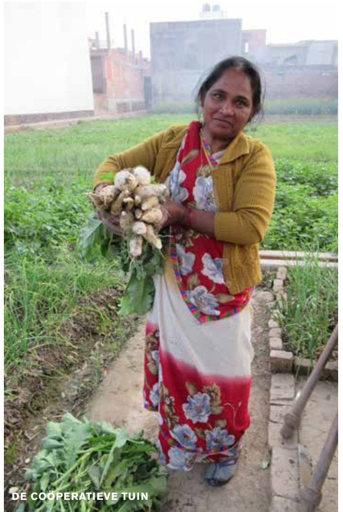
DE COÖPERATIEVE TUIN