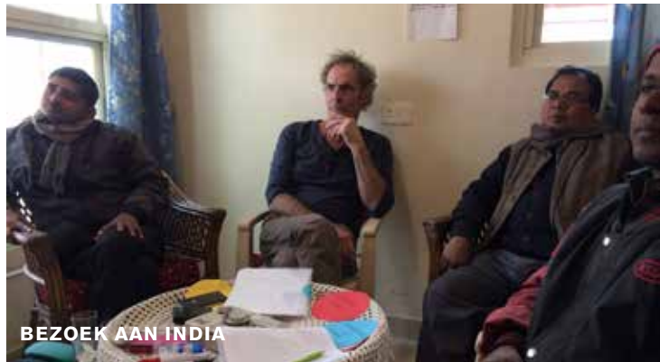
BEZOEK AAN INDIA