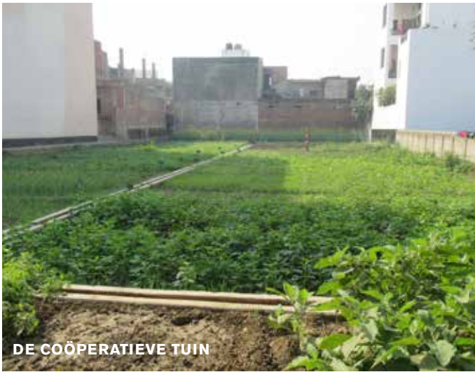
DE COÖPERATIEVE TUIN