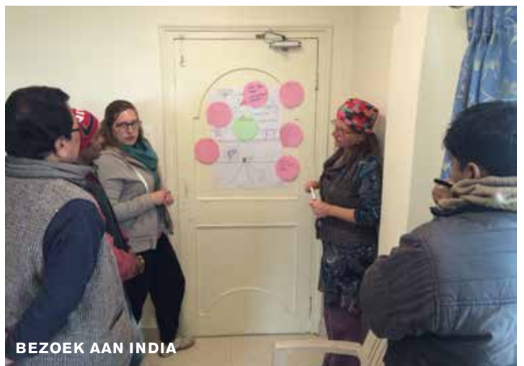
BEZOEK AAN INDIA