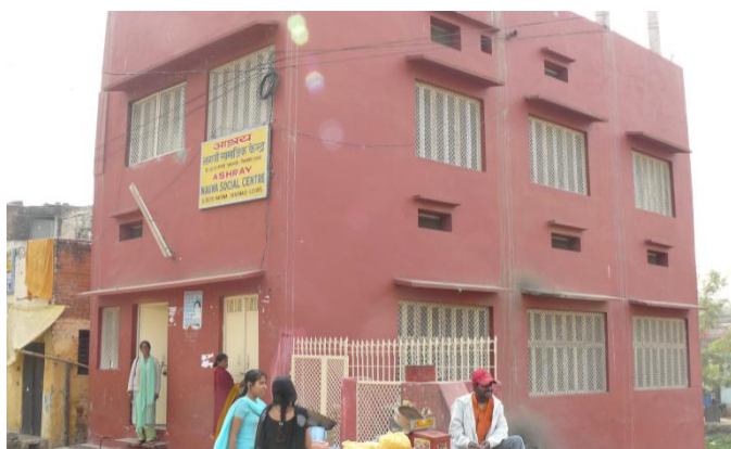
Ashray Social and Health Centre